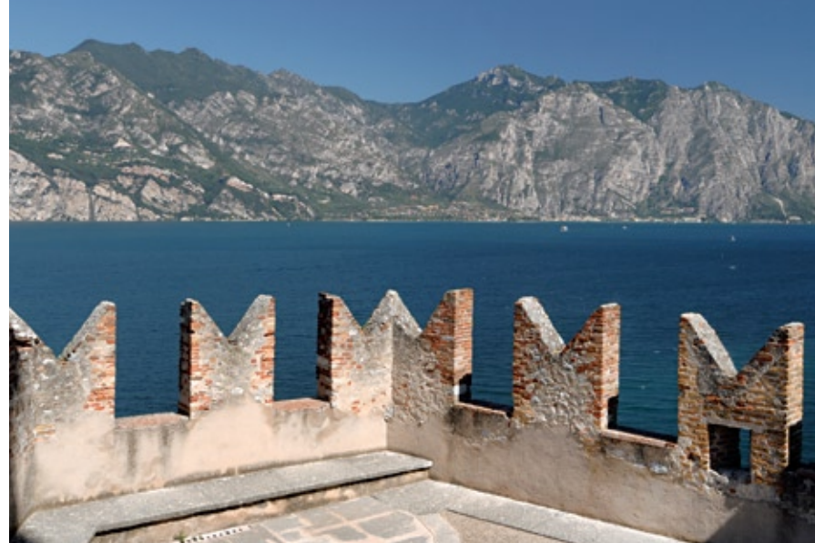
Veduta dal tetto a terrazza della polveriera austriaca

con volta a botte in cotto. Il tetto a terrazza, sul quale al bisogno potevano essere posti i cannoni, è circondato da un parapetto.