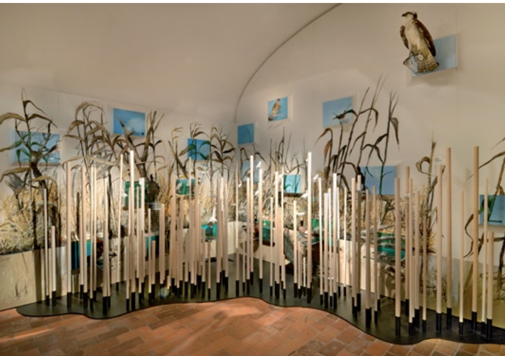
Interni del nuovo Museo