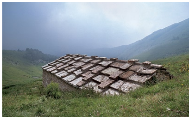
Malga con il caratteristico tetto a due spioventi di lastre di calcare

Uno spettacolo per tutti, turisti e appassionati di sport estivi e invernali, che dalla visita a Malcesine e al Monte Baldo portano con sé il ricordo indelebile dello spettacolo della natura, della storia e dell'arte in un tripudio di colori, sfumature, emozioni, impressioni, luce, riflessi dell'acqua, monti, cipressi e olivi così cari ai pittori vedutisti e ai fotografi di fine Ottocento e primo Novecento.