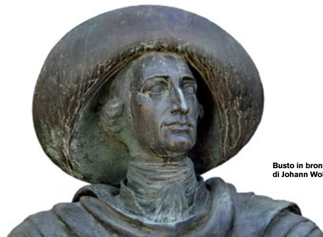
Busto in bronzo di Johann Wolfgang Goethe

La seconda stanza è dedicata al soggiorno di Johann Wolfgang Goethe a Malcesine. Il grande poeta e scrittore, colpito dall'atmosfera speciale del luogo e dal fascino decadente del Castello, il 13 e il 14 settembre 1786 ritrasse l'edificio in alcuni disegni diventando l'involontario protagonista di un malinteso con le truppe d'occupazione