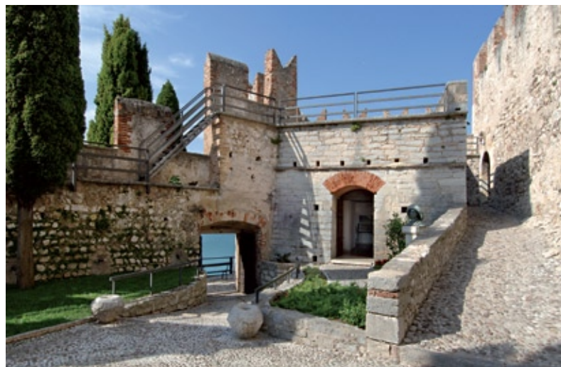
Cortile interno e polveriera austriaca

L'edificio, costruito dagli Austriaci nel 1863, occupa l'angolo nord-orientale del cortile interno. Il tozzo corpo della costruzione, a un piano, comprende due vani