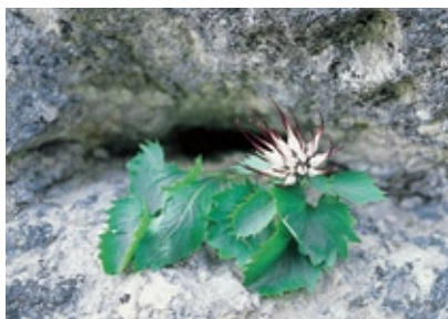
In senso orario: Veduta della Colma di Malcesine dal Monte Altissimo; Giglio caprino; Raponzolo di roccia; Giglio di San Giovanni; Genziana di Koch