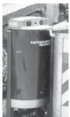
Contenitore "pile usate"

Collabora con il tuo comune e fai presente eventuali disservizi.