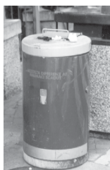
Contenitore "medicinali scaduti"