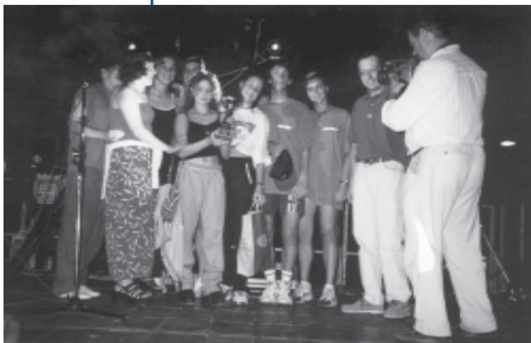
Premiazioni "Festa dei giovani 98"

La vigilanza, la verifica, le definizioni delle controversie, nonché l'attuazione di poteri sostitutivi degli obblighi assunti dalle amministrazioni sottoscrittrici l'accordo sarà affidata ad un Collegio di Verifica.