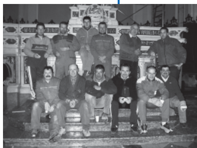
Alcuni partecipanti ai lavori di montaggio dell'ultimo triduo

È l'ultima associazione nata a Malcesine, ma è quella che si occupa di una delle nostre tradizioni più antiche. Parliamo di "Per il Triduo", il sodalizio che si è costituito fra malcesinesi per mettere a disposizione della Parrocchia e della Comunità tutta l'esperienza e le conoscenze di cui dispone per l'allestimento delle strutture, per l'accensione delle candele e per ogni altro aspetto concernente quella che resta una delle