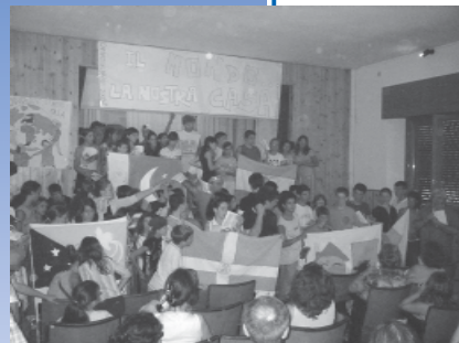
Lo spettacolo finale