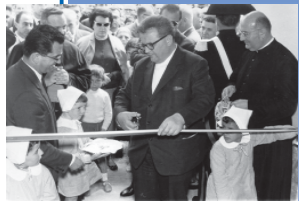
L'inaugurazione dell'asilo del 1961 con il Ministro Trabucchi, il Sindaco Andreoli e Don Emilio Berti

Sempre nell'ambito dei servizi sociali vorrei ricordare che sono praticamente terminati i lavori di manutenzione di alcuni locali di Palazzo dei Capitani destinati ad ospitare la nuova sede del Corpo Bandistico di Malcesine. Questa Amministrazione si è sempre dimostrata disponibile e sensibile alle problematiche di questa associazione anche per il ruolo di aggregazione e coesione sociale che essa svolge e ha ritenuto opportuno e legittimo attivarsi al fine di dare una risposta stabile e duratura nel tempo dopo che la stessa era stata privata in seguito ai lavori di realizzazione del Polo Scolastico della propria sede presso la Scuola Elementare.