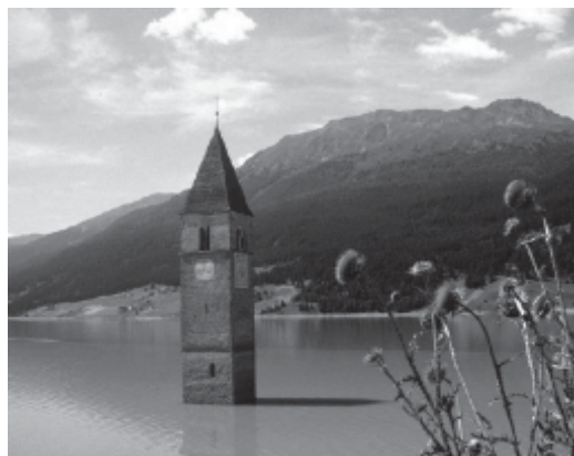
Il campanile di Curon (Val Venosta)