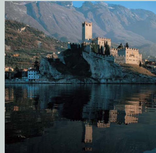
Malcesine, lago di Garda · Il Castello Scaligero Malcesine, Lake Garda · Scaligeri castle