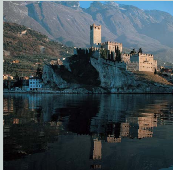
Malcesine, lago di Garda · Il Castello Scaligero Malcesine, Lake Garda · Scaligeri castle

In a sense, his photographic career developed parallel to his reporting career: for him it was a tool to look at reality and interpret and describe it with pictures rather than words. At the end of the Eighties he began photo reporting mainly concentrated on the cultures and societies of countries like Asia and Latin America. His photos have been published by numerous current affairs and travel magazines, like Geo (in France), Animan (in Switzerland), Uno (in Australia), D de La Repubblica, GenteViaggi, Alisei, Atlante, Panorama Travel, Gulliver, Elle, Amica, Grazia.