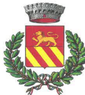
Comune di Brenzone sul Garda (VR)