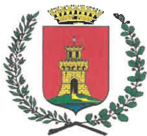
Comune di Malcesine (VR)